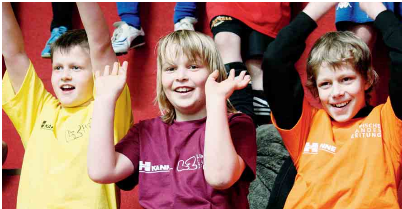
Gute Stimmung im Publikum: Auch in den Spielpausen herrscht auf den Rängen eine tolle Atmosphäre.