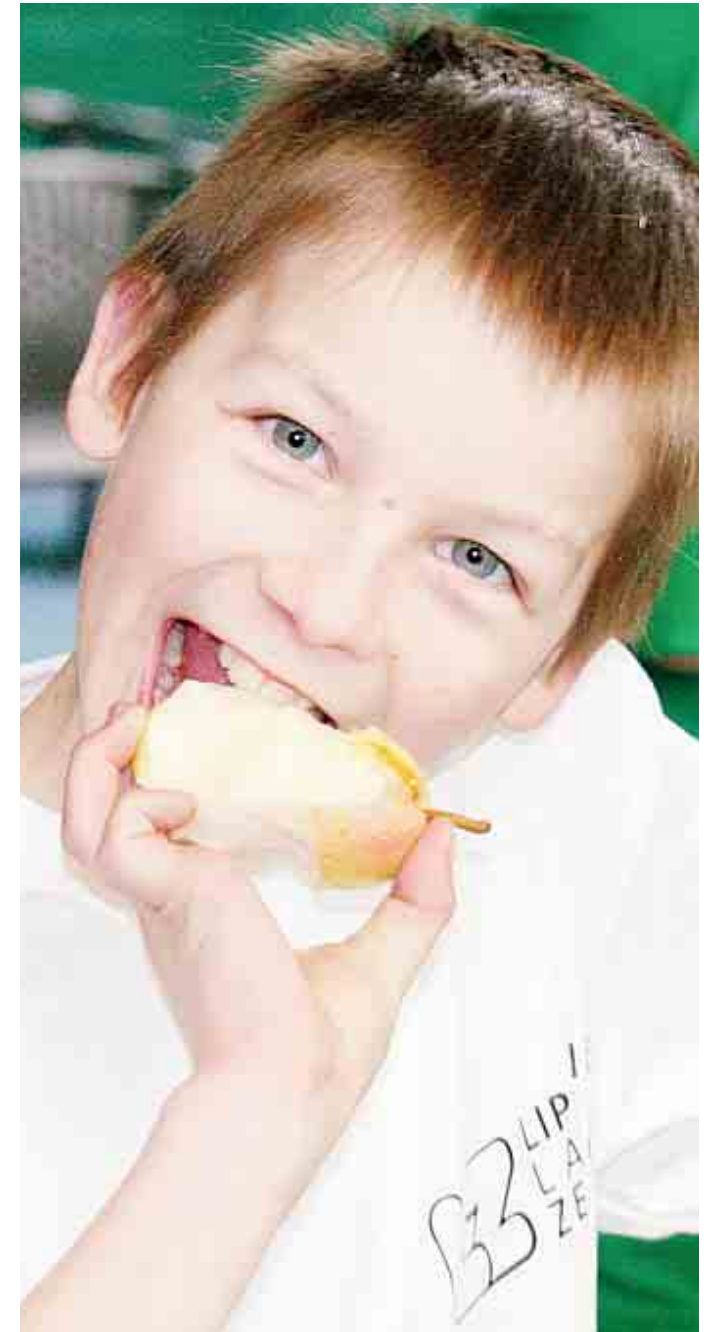
Auftanken für den nächsten Kick: In den Pausen stärken sich die jungen Fußballer mit reichlich Obst.